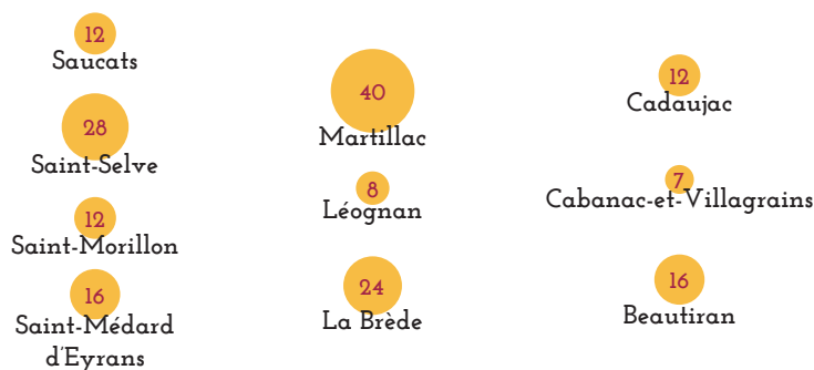
NOMBRE DE PLACES D'ACCUEIL AUPRÈS DES ASSISTANT(E)S MATERNEL(LE)S EN M.A.M - CCM 2018

À Martillac, 40 % des places en accueil individuel sont des places d'accueil en M.A.M., 26 % à Saint-Selve et Saint-Morillon.